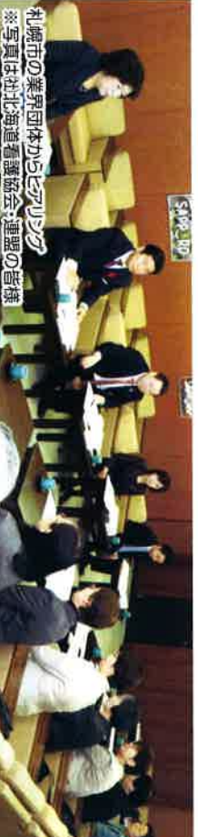
札幌市の業界団体からヒアリング ※写真は北北海道看護協会・連盟の皆様