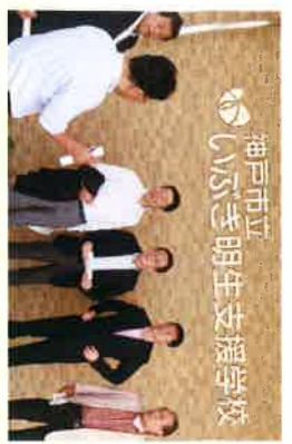
神戸市立 いいじま明生支援学校を視察 (神戸市)