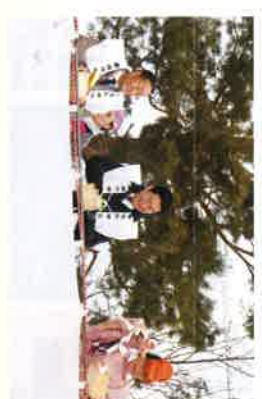
西野神社分祭にて