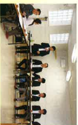
新幹線建設発生土問題について議論