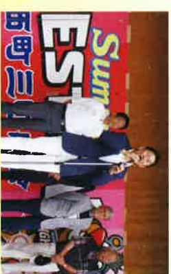
西町三町内会サマーフェスティバル会場にてあいさつ