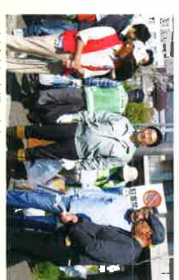
突発川清掃事業に参加