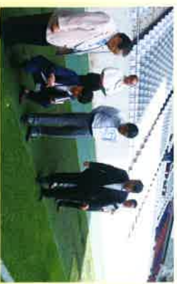
教育プロジェクトといいじま明生支援学校を視察 (神戸市)