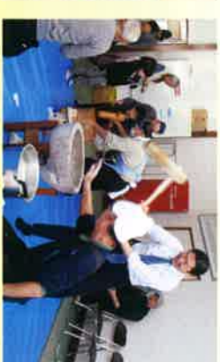
子ども餅つき大会にて一緒に餅つき