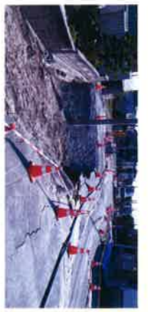
写真は甚大な被害を受けた里塚地区