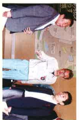
円山動物園にて完成した新施設「ソウキ」を視察