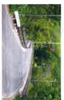
運搬ルートの盤溪地区札幌橋付近