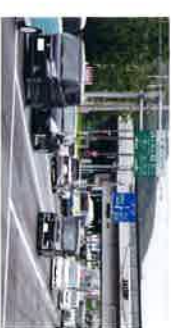
混雑する札幌西IC付近

小樽方面の上り線入り口と旭川・苫小牧方面の下り線出口のみの札幌道札幌西ICは周辺の交通渋滞を引き起こすだけでなく、一般市民の皆様や観光客、物流関係者や救急医療の面からも改善が求められてきました。2017年9月の第3回定例会において、「新川ICの渋滞緩和も視野に入れ、上下線共に乗降口を備えたフル規格化の整備」を提言しましたが、これを契機に今年5月、北海道横断自動車道(札幌自動車道)札幌西ICフル規格化建設期成会」が発足。同僚の議員の皆様とともに顧問に就任しました。現在、周辺地域の皆様を中心に署名活動を行っており、札幌西ICのフル規格化に向けて市民の声を関係機関へ届け、期成会が一丸となって実現に向けて取り組んでまいります。