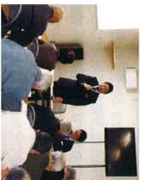
地域の皆さまに状況報告(福井会館)

2030年度末の開業を目指し、鋭意工事が進められている北海道新幹線札幌延伸ルートでは新小樽(仮称)～札幌間において、今後5～6年程度、建設発生土(環境基準値以下の無対策土)が盤溪の受入地へ運搬されます。このため、宮の沢～西野～福井～盤溪のルートではタンクカーの往来が激しくなることから、先だって福井・西野・西町地区内会の皆様から運搬に伴う渋滞や安全対策に関するご要望をいただきました。工事を担当する鉄道・運輸機構北海道局からは要望に対しては、必要に応じて陳情に伺い、万全の体制で運搬車両の管理を行うことを求めています。地域住民の皆様には日常生活に大きな支障がないよう取り組んでまいりますので、ご理解とご協力をお願い致します。