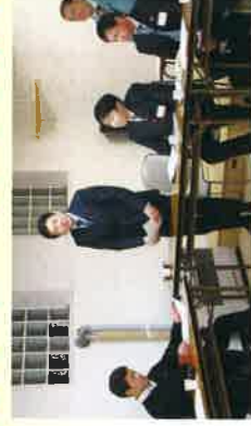
新幹線トンネル工事発生士処説明会にて