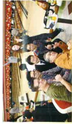
ボウリング大会にて地域の皆さまと