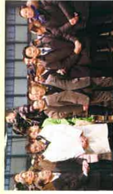
札幌中央卸売市場初開式に参加