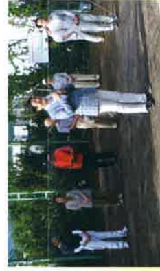
町内会ソフトボール大会開会式