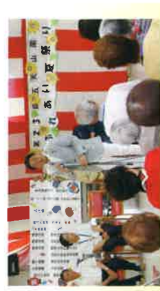
老人保健施設ふれあい夏祭りにて