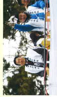
西野神社にて節分の豆まき