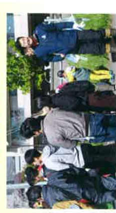
西野中立的内会夢似発寒川一斉清掃に参加