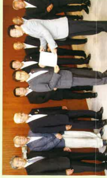
札幌市長へ要望書と2万筆超の署名を提出