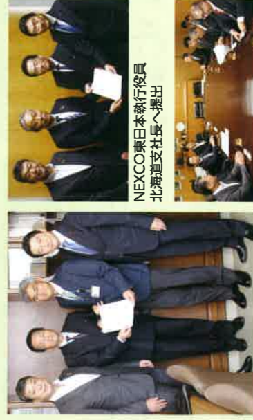
NEXCO東日本執行役員 北海道支社長へ提出